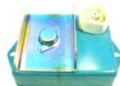
SV1808-MCM850 MODULO E.E CHRYSLER 4 PUNTAS USA