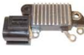
SV1808-RVH200016 REGULADOR IH761 HITACHI NISSAN TSURU DERECHO