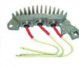
SV1808-PC07HV PORTA DIODO LR97084 LEECE-NEVILLE (+)