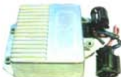
SV1808-MFM184 MODULO E.E FORD TOPAZ 2 CAMPANAS AZUL