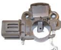
SV1808-RV20097 REGULADOR IM265 MITSUBISHI FORD PICK-UP