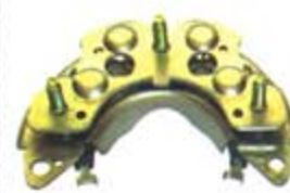
SV1808-PH40C PORTA DIODO IHR720 HITACHI NISSAN TSURU