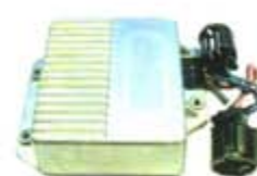
SV1808-MDY249 MODULO E.E FORD 2 CAMPANAS CAFE