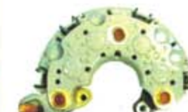
SV1808-PH14 PORTA DIODO INR727 NIPPONDENSO CHRYSLER