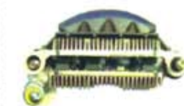
SV1808-PM38 PORTA DIODO IMR8548 MITSUBISHI ESCORT