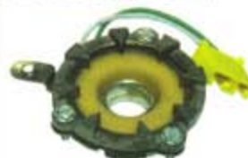
SV1808-MLX302 MAGNETO CHEVROLET PICK-UP 8CIL 75/89