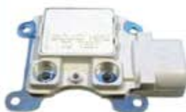
SV1808-RGR814 REGULADOR F795 FORD 3G 95A BLANCO E/OVALADO