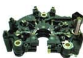
SV1808-PB122H PORTA DIODO IBR852 BOSCH GOLF/JETTA A3