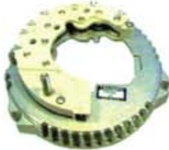
SV1808-PF05 PORTA DIODO FR202 FORD 3G 130A