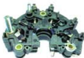
SV1808-PB121H PORTA DIODO IBR844 BOSCH MERCEDES 90A 12V