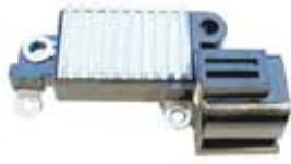
SV1808-RVH200017 REGULADOR IH248 HITACHI PATHFINDER 3.0L