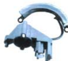
SV1808-MLX222 MAGNETO FORD PICK-UP STD 74/97