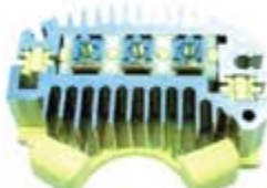
SV1808-PD12 PORTA DIODO DR5050 DELCO GM CUTLASS