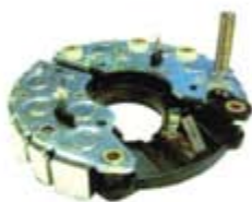
SV1808-PB76H PORTA DIODO IBR350 BOSCH VW AUDI