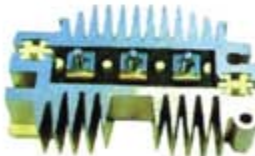
SV1808-PD31 PORTA DIODO DR5070 DELCO GM CENTURY 70A