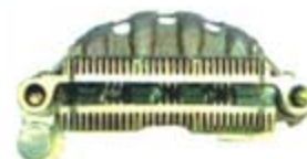
SV1808-PM42 PORTA DIODO IMR10044 MITSUBISHI SUBARU