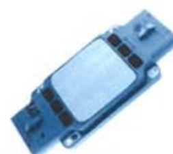
SV1808-MLX230 MODULO DISK FORD RANGER 4CIL 89/97