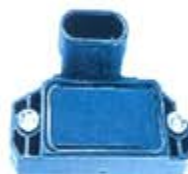
SV1808-MD1971A MODULO IGNICION GM PICK-UP MODERNO = LX355