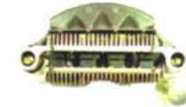
SV1808-PM32 PORTA DIODO IMR8570 MITSUBISHI TAURUS