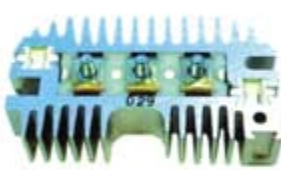
SV1808-PD09 PORTA DIODO DR5040 DELCO CHICO 10SI