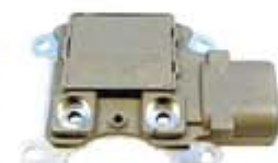
SV1808-RGR786 REGULADOR F794 FORD 3G 95A GRIS E/OVALADO