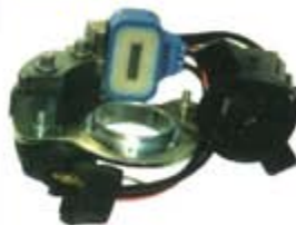
SV1808-MLX204 MAGNETO FORD COUGAR THUNDERBIRD 74/97