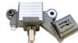
SV1808-RVH200020 REGULADOR IH249 HITACHI NISSAN 300 ZX