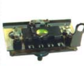
SV1808-PH49 PORTA DIODO IHR1000 HITACHI DATSUN