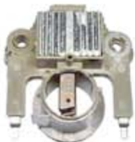
SV1808-RV200949 REGULADOR IM232 MITSUBISHI FORD