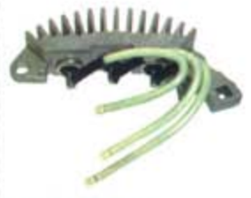
SV1808-PC06HV PORTA DIODO LR79145 LEECE-NEVILLE (-)