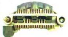
SV1808-PM12 PORTA DIODO IMR7552 MITSUBISHI MAZDA