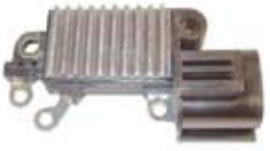
SV1808-RVH200018 REGULADOR IH762 HITACHI NISSAN TSURU IZQUIERDO