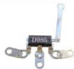
SV1808-TDT10 TRIDIODO DELCO T0985 21SI KENWORTH 130A