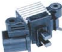
SV1808-RVH200011 REGULADOR HITACHI NISSAN 88-90 14V