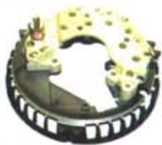
SV1808-PF10 PORTA DIODO FR600 FORD 6G 105A WINDSTAR