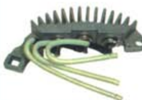
SV1808-PC05HV PORTA DIODO LR79193 LEECE-NEVILLE (+)