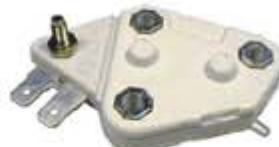
SV1808-RD672 REGULADOR DELCO D104HD 27,30SI 24V