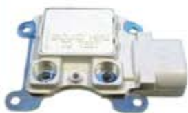
SV1808-RGR814 REGULADOR F795 FORD 3G 95A BLANCO E/OVALADO