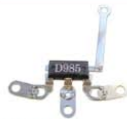
SV1808-TDT10 TRIDIODO DELCO T0985 21SI KENWORTH 130A