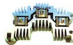
SV1808-PD05 PORTA DIODO DR5173 DELCO KENWORTH 21SI