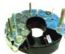
SV1808-PB62H PORTA DIODO IBR341 BOSCH MERCEDES 24V