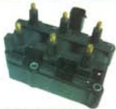
SV1808-BRUF53 BOBINA E.E DODGE CAMIONES V6 94/99 C881