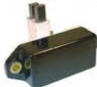
SV1808-RVB198 REGULADOR IB379 BOSCH AUTOBUS SCANIA 24V