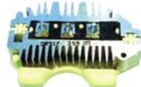
SV1808-PD15 PORTA DIODO DR5170 DELCO GM CUTLASS