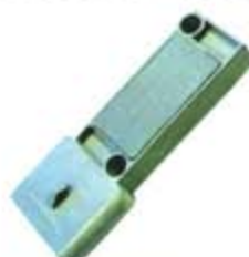
SV1808-MFM533 MODULO ENCENDIDO FORD 6 PUNTAS