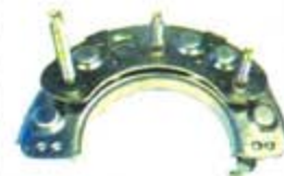
SV1808-PH18C PORTA DIODO IHR732 HITACHI NISSAN 65A