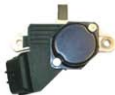
SV1808-RVB250 REGULADOR IB501 BOSCH NISSAN TSURU III