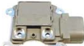
SV1808-RGR786M REGULADOR F794HD FORD 3G 130A GRIS