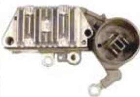
SV1808-RH2005-4A REGULADOR IN220 NIPPONDENSO HONDA, ACCORD.