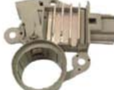
SV1808-RGR900 REGULADOR F500 FORD 6G 105A