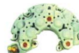
SV1808-PN02 PORTA DIODO INR728 NIPPONDENSO CHRYSLER