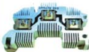
SV1808-PD06A PORTA DIODO DR5176 DELCO KENWORTH 21SI