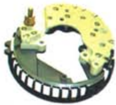
SV1808-PF11 PORTA DIODO FR601 FORD 6G 105A CONTOUR