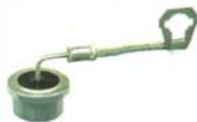
SV1808-DD1001 DIODO BANDERA (-)