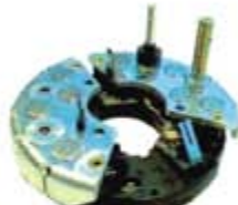
SV1808-PB80H PORTA DIODO IBR324 BOSCH FORD