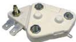
SV1808-RD668C REGULADOR DELCO INTEGRADO VR162 12V