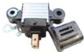
SV1808-RVH20005 REGULADOR IH242 ALTERNADOR NISSAN 200SX