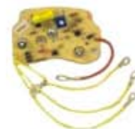
SV1808-RVRD812 REGULADOR DELCO FAMSA 25SI 12V