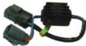
SV1808-MDNS655 MODULO E.E NISSAN 86/89 2 CAMPANAS