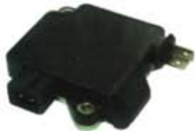
SV1808-MNS004 MODULO NISSAN HITACHI 90/96 4T=HM700