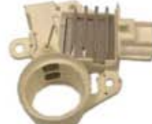
SV1808-RGR920 REGULADOR F602 FORD 6G CONTOUR