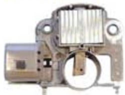
SV1808-RV200910N REGULADOR IM268 MITSUBISHI FORD TOPAZ