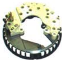
SV1808-PF12 PORTA DIODO FR602 FORD 6G 135A