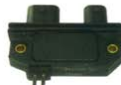
SV1808-MDM1990 MODULO CHEVROLET 8 PUNTAS V6 MOTOR 350