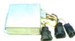
SV1808-MDY297 MODULO E.E FORD 3 CAMPANAS AMARILLA