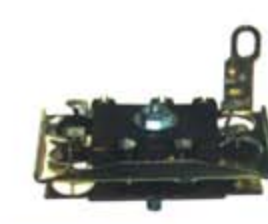
SV1808-PH51 PORTA DIODO IHR1001 HITACHI DATSUN IZQUIERDA