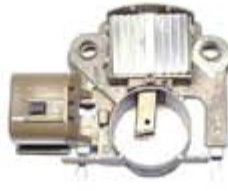
SV1808-RV200925 REGULADOR IM272 MITSUBISHI FORD COUGAR