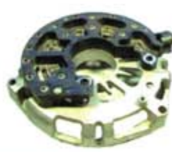
SV1808-PF06 PORTA DIODO FR300 FORD 4G 130A