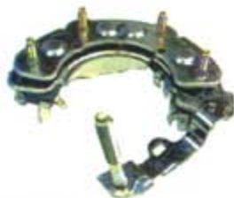
SV1808-PH42 PORTA DIODO IHR717 HITACHI NISSAN MAXIMA