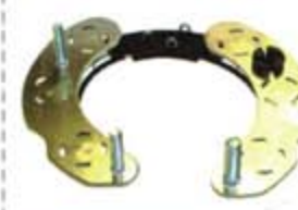
SV1808-PF08H PORTA DIODO FR1070 FORD 1G 65A HERRADURA