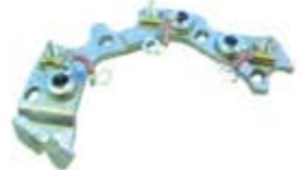
SV1808-PD27H PORTA DIODO DR1670 DELCO FAMS(+ ) 12V