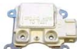
SV1808-RGR818 REGULADOR F786 FORD 3G 90A BLANCO