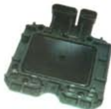
SV1808-MD1929AB MODULO DISK GM 4CIL 2.5L 87/92 = LX344