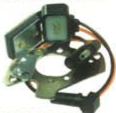
SV1808-MLX102 MAGNETO CHRYSLER PICK-UP 8CIL 72/89