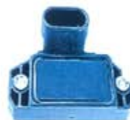
SV1808-MD1971A MODULO IGNICION GM PICK-UP MODERNO = LX355