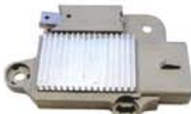
SV1808-RGR817 REGULADOR F798 MOTORCRAFT 4G 130A GRIS