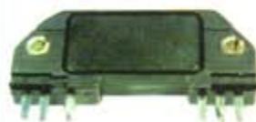
SV1808-MDM1951 MODULO IGNICION CHEVROLET 6 PUNTAS