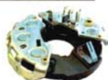
SV1808-PB01 PORTA DIODO IBR303 BOSCH CARIBE 55A