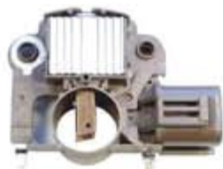
SV1808-RV200915 REGULADOR IM271 MITSUBISHI FORD TAURUS