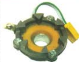
SV1808-MLX309 MAGNETO CHEVROLET CUTLASS 6CIL 80/82