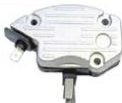
SV1808-RVLC111B REGULADOR IL225 TRACTOR M FERGUSON 24V