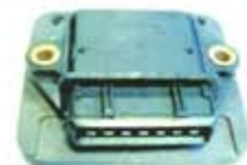
SV1808-MH005 MODULO E.E VW CARIBE JETTA = 8M342