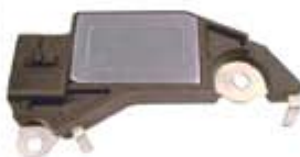
SV1808-RD694X REGULADOR DELCO D411 CUTLASS CS130 105A