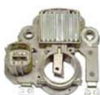
SV1808-RV200971 REGULADOR IM850 MITSUBISHI HONDA CIVIC