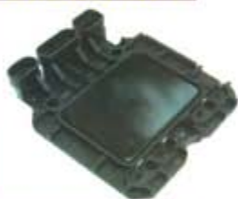
SV1808-MD1927AB MODULO DISK CAVALIER 4C 2.1L 87/95 = LX345