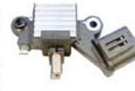
SV1808-RVH200020 REGULADOR IH249 HITACHI NISSAN 300 ZX