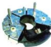
SV1808-PB78HA PORTA DIODO IBR547 BOSCH SCANIA 24V