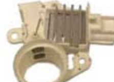
SV1808-RGR920 REGULADOR F602 FORD 6G CONTOUR