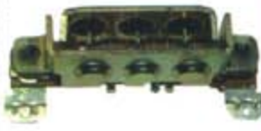
SV1808-PM60 PORTA DIODO IMR71111 MITSUBISHI CHRYSLER