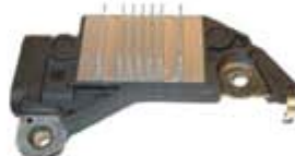
SV1808-RD705 REGULADOR DELCO D705 CUTLASS MODERNO