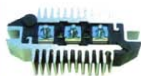
SV1808-PD20 PORTA DIODO DER1004 GM CHEVY VALEO