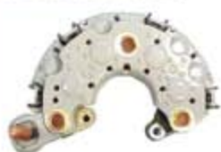
SV1808-PN14 PORTA DIODO INR727 NIPPONDENSO LEBARON