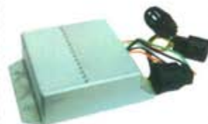
SV1808-MDY204 MODULO E.E FORD 2 CAMPANAS ROJO