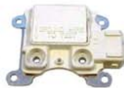
SV1808-RGR818 REGULADOR F786 FORD 3G 90A BLANCO