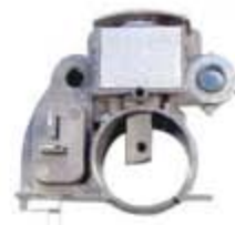
SV1808-RV20094 REGULADOR IM216 MITSUBISHI MAZDA