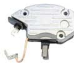
SV1808-RVL113L REGULADOR IL224 LUCAS NEW HOLLAND 24V