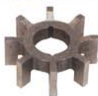
SV1808-RLX206 RELUCTOR DISTRIBUIDOR FORD 8CIL