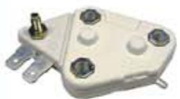
SV1808-RD684 REGULADOR DELCO D22 KENWORTH 22SI 12V