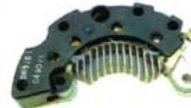
SV1808-PD96 PORTA DIODO DR5161 DELCO CUTLASS