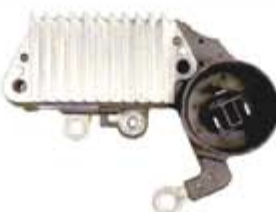
SV1808-RV200525 REGULADOR IN252 NIPPONDENSO GM GEO