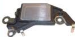
SV1808-RD424 REGULADOR DELCO D424 CUTLASS CS121 95A