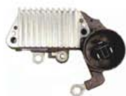
SV1808-RH200523A REGULADOR IN250 NIPPONDENSO TOYOTA