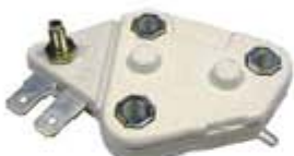
SV1808-RD687 REGULADOR DELCO D30 30SI 36V 60A