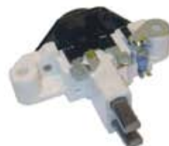
SV1808-RVR201 REGULADOR IB387 BOSCH GOLF JETTA A3