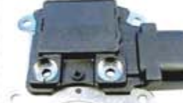
SV1808-RGR811 REGULADOR F785 FORD 3G 130A GRIS CUADRADO