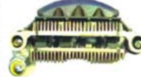
SV1808-PM29 PORTA DIODO IMR8540 MITSUBISHI TOPAZ