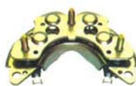
SV1808-PH39C PORTA DIODO IHR719 HITACHI NISSAN