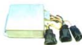
SV1808-MDY297 MODULO E.E FORD 3 CAMPANAS AMARILLA