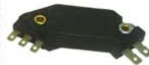
SV1808-MDM1918 MODULO IGNICION CHEVROLET 5 PUNTAS