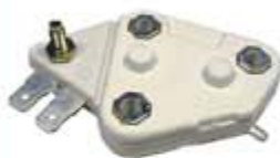
SV1808-RD684 REGULADOR DELCO D22 KENWORTH 22SI 12V