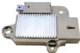
SV1808-RGR817 REGULADOR F798 MOTORCRAFT 4G 130A GRIS