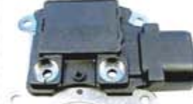
SV1808-RGR811 REGULADOR F785 FORD 3G 130A GRIS CUADRADO