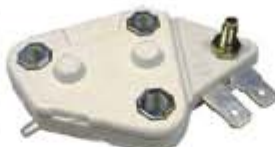
SV1808-RD669C REGULADOR DELCO D27 10,20,27SI 12V