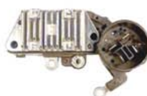
SV1808-RV20058 REGULADOR IN225 NIPPONDENSO HONDA ACURA.