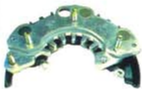
SV1808-PH23 PORTA DIODO IHR752 HITACHI NISSAN PICK-UP