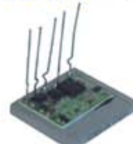
SV1808-TV20005S TRIDIODO ALTERNADOR HITACHI REGULADOR IH242