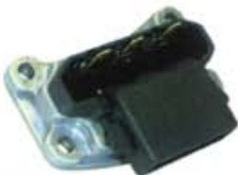
SV1808-PF01 PORTA DIODO FR192 FORD 2G 55A