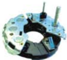
SV1808-PB05 PORTA DIODO IBR316 BOSCH CARIBE 65A