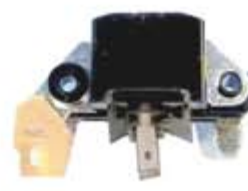
SV1808-RV20093 REGULADOR IM225 MITSUBISHI NISSAN MAZDA