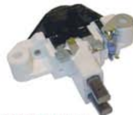
SV1808-RVR201H REGULADOR IB387 BOSCH GOLF JETTA A4