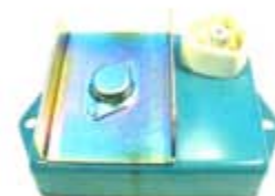
SV1808-MCM850 MODULO E.E CHRYSLER 4 PUNTAS USA