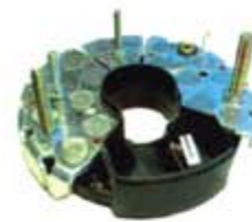
SV1808-PB62H PORTA DIODO IBR341 BOSCH MERCEDES 24V