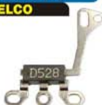
SV1808-TDT01 TRIDIODO DELCO 528 CHICO (JIRAFÁ) 10SI