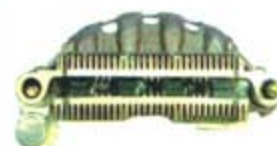
SV1808-PM42 PORTA DIODO IMR10044 MITSUBISHI SUBARU