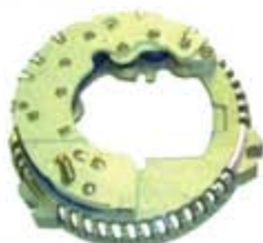
SV1808-PF04 PORTA DIODO FR201 FORD 3G 95A