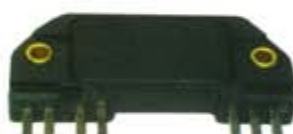
SV1808-MDM1961 MODULO ENCENDIDO GM 7 PUNTAS RECTAS