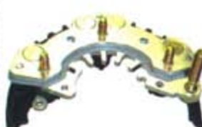
SV1808-PH25 PORTA DIODO IHR754 HITACHI NISSAN SENTRA