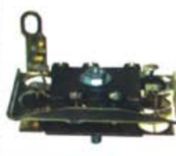
SV1808-PH50 PORTA DIODO IHR1002 HITACHI DATSUN DERECHA