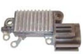
SV1808-RVH200018 REGULADOR IH762 HITACHI NISSAN TSURU IZQUIERDO