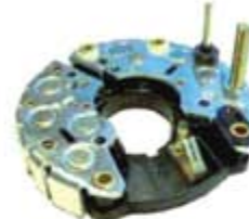
SV1808-PB54 PORTA DIODO IBR354 BOSCH MERCEDES 55A