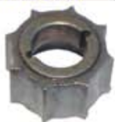
SV1808-RLX104 RELUCTOR DISTRIBUIDOR CHRYSLER 8CIL