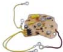
SV1808-RVRD824 REGULADOR D824 DELCO FAMSA 25SI 24V