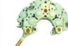
SV1808-PN13 PORTA DIODO INR720 NIPPONDENSO HONDA