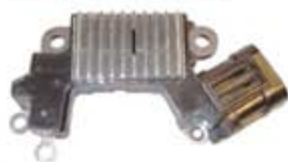
SV1808-RVH200038 REGULADOR IH767 HITACHI NISSAN ALTIMA