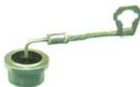
SV1808-DD1002 DIODO BANDERA (+)