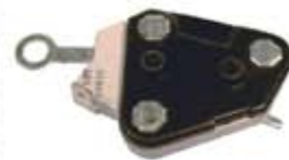
SV1808-RD674 REGULADOR DELCO DE605 A GM CHEVY 12V 65