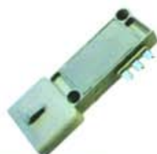
SV1808-MFM425 MODULO FORD COUGAR 9 PUNTAS GRIS