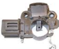
SV1808-RV20097 REGULADOR IM265 MITSUBISHI FORD PICK-UP