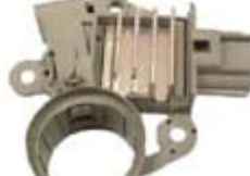
SV1808-RGR900 REGULADOR F500 FORD 6G 105A