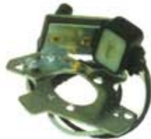
SV1808-MLX103 MAGNETO CHRYSLER PICK-UP 6CIL 75/85