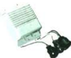
SV1808-MDY237 MODULO E.E FORD 3 CAMPANAS AMARILLA