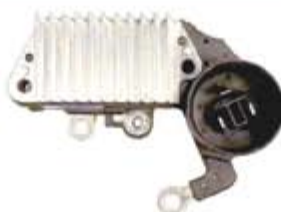
SV1808-RV200525 REGULADOR IN252 NIPPONDENSO GM GEO