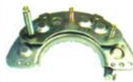
SV1808-PH03 PORTA DIODO IHR709 NISSAN HITACHI SENTRA