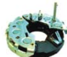
SV1808-PB02 PORTA DIODO IBR304 BOSCH CARIBE 65A