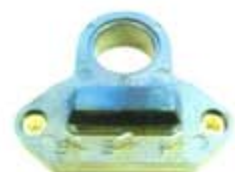
SV1808-MNS003 MODULO NISSAN HITACHI 80/84 3T = HM560