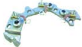
SV1808-PD27H PORTA DIODO DR1670 DELCO FAMS(+ ) 12V