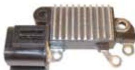
SV1808-RVH200016 REGULADOR IH761 HITACHI NISSAN TSURU DERECHO