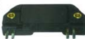
SV1808-MDM1959 MODULO IGNICION GM 4 PUNTAS DELGADAS