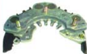
SV1808-PH21 PORTA DIODO IHR750 HITACHI SUBARU 2.2L