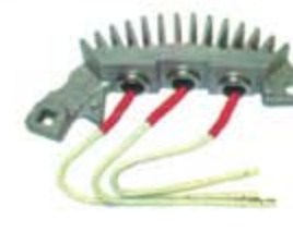
SV1808-PC08HV PORTA DIODO LR97085 LEECE-NEVILLE (-)