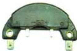
SV1808-MM001 MODULO E.E MITSUBISHI COURIER=M806