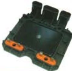
SV1808-MD1969AB MODULO DISK GM 4C 2.0/2.1LTS 92/98 = LX345