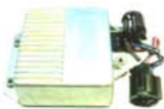
SV1808-MDY166 MODULO E.E FORD 2 CAMPANAS VERDE