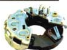
SV1808-PB01 PORTA DIODO IBR303 BOSCH CARIBE 55A