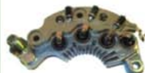
SV1808-PD04B PORTA DIODO DER2000 DELCO GM CHEVY 95