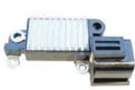
SV1808-RVH200017 REGULADOR IH248 HITACHI PATHFINDER 3.0L