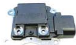
SV1808-RGR784 REGULADOR F784 FORD TOPAZ NEGRO 2G 75A