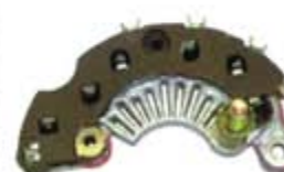
SV1808-PD99 PORTA DIODO DR4200 DELCO CUTLASS MODERNO